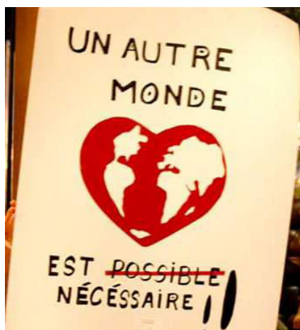
«Se necesita otro Mundo»

Hablar de migración ambiental supone un replanteamiento completo del paradigma de desarrollo. Las formas de desarrollo que actualmente se basan en la cooperación con los países del Sur, a través de la asistencia financiera, material o logística, no constituyen una respuesta adecuada a la migración ambiental. Requieren, por tanto, del apoyo de una respuesta en términos de gobernanza internacional.