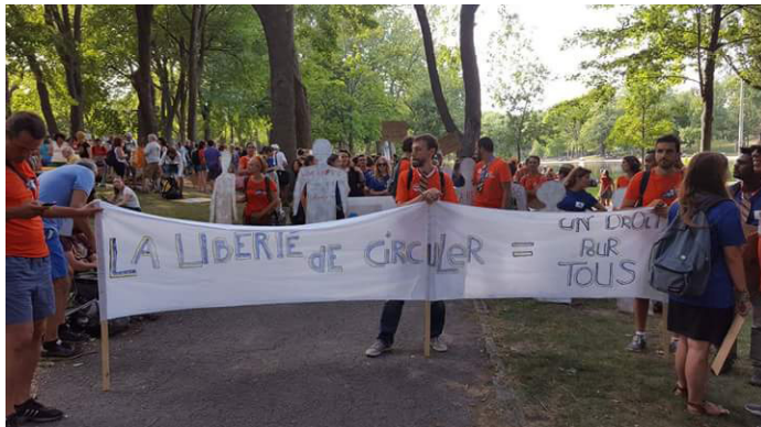
«La libertad de movimiento es un derecho para todos»